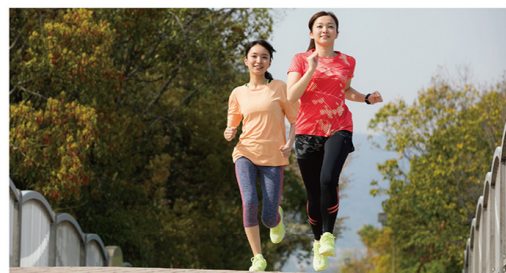
ホテルニューアワジグループのSDGs https://www.newawaji-hotels.com/sdgs/

豊かな自然の中、ウォーキングやランニングなどで心地よい汗を。木々の美しさや、雄大な海を眺めていると、より一層リラックス効果が高まります。運動後はゆったりと温泉に入り、体にやさしい地元食材の料理を堪能することで心も身体も健康に。食・温泉・自然や景観の地域資源を最大限に活かし、旅と健康を結び付けるスポーツツーリズムの取り組みにも力を注いでいます。